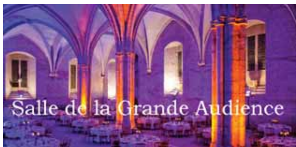
Salle de la Grande Audience