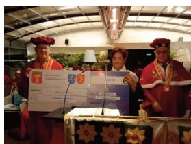
Association les sclérosés en plaques Loire Sud