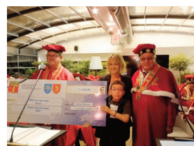
Association petite traversée pour Maé