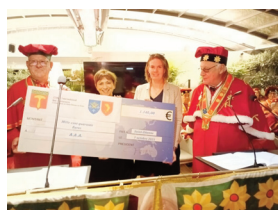
Association apprendre l'Autisme autrement