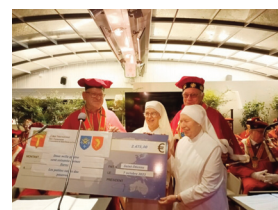
Institution petites soeurs des pauvres

La Commanderie de Saint-Etienne en Forez a donné de l'espoir aux malades et aux personnes souffrant de handicap en remettant, en 2023, la somme totale de 11.500 €.