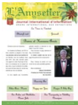
N°80 : 2017 - Michel Champion