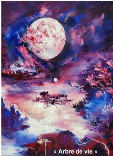
« Arbre de vie »