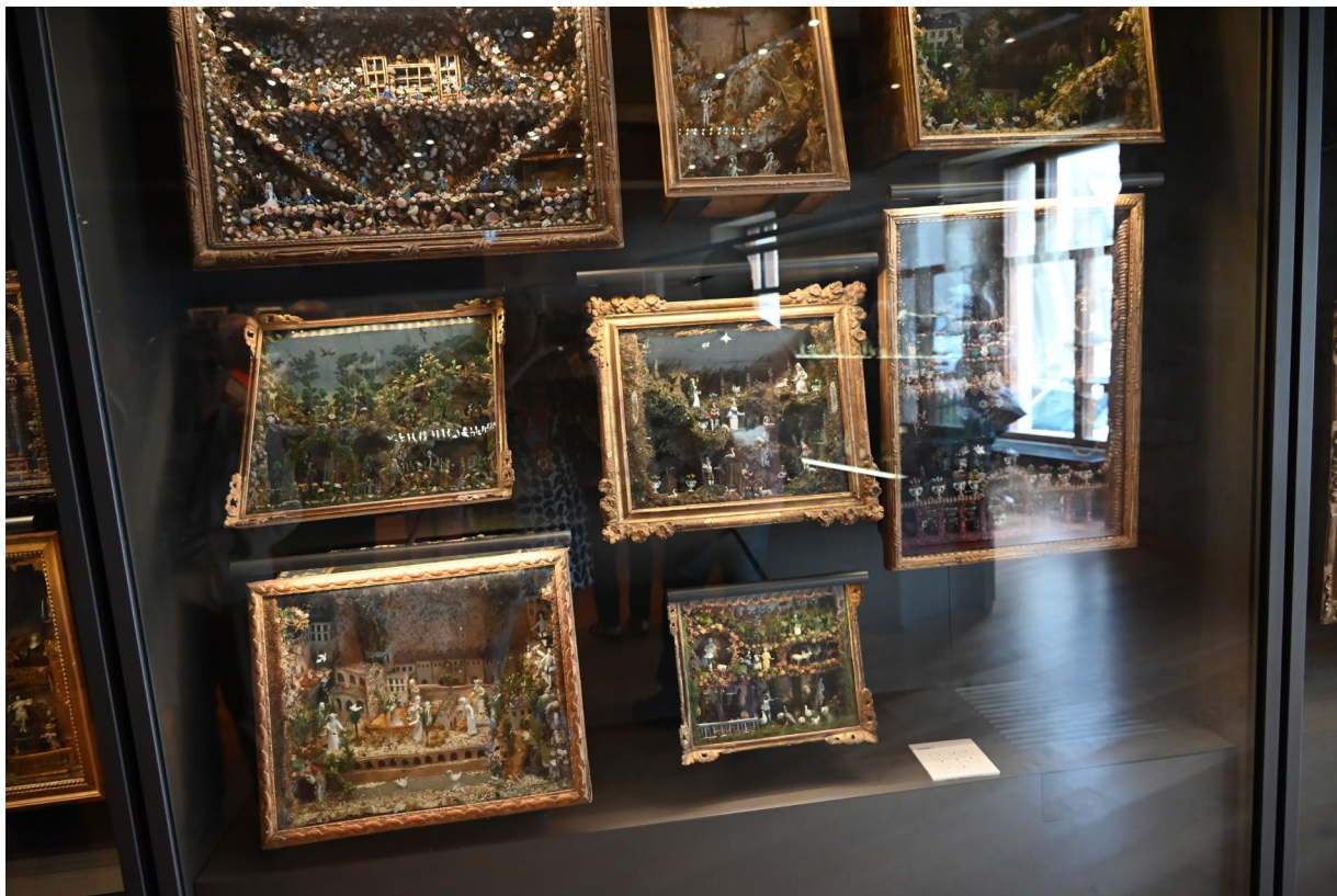
Compositions en verre émaillé.

La collection de verre émaillé, réunie notamment par Jean Loynel d'Estrie, a été reçue par le Musée du Louvre par dation en paiement de droit de succession en décembre 1997. À l'exception d'un retable du Baptême du Christ au Louvre 4 , les pièces de la collection est déposée par le musée du Louvre au musée de Nevers en 1998.