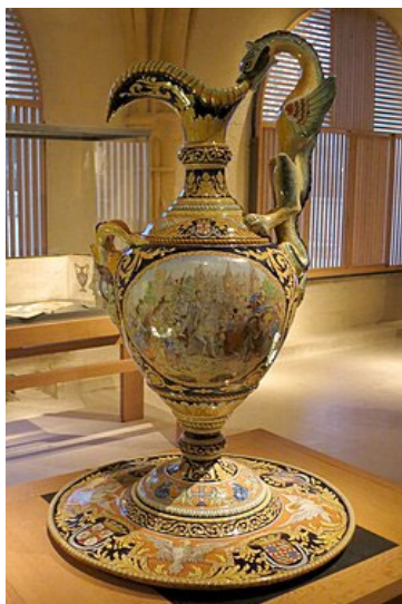
Aiguière produite par la faïencerie Montagnon.

On y découvre ainsi une superbe collection de plats d'ornement, des coupes, des bouteilles, des aiguières, des carreaux, des plaques décoratives, des statues mais aussi des objets plus pittoresques, tels une mandoline, un violon ou encore un service à fumeur. A travers ce parcours, le visiteur découvre ce que la création faïencière a offert en diversité et qualité durant quatre siècles.